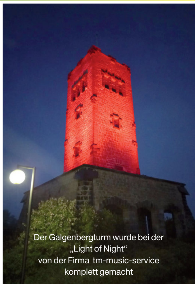
Der Galgenbergturm wurde bei der „Light of Night“ von der Firma tm-music-service komplett gemacht